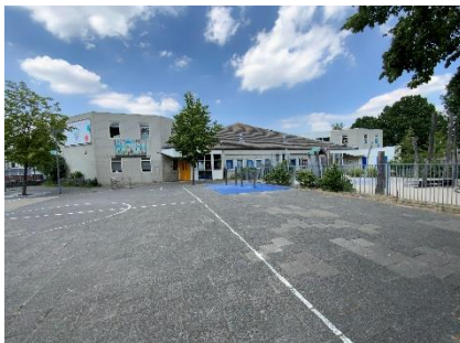
DNH Integraal Kindcentrum (IKC)